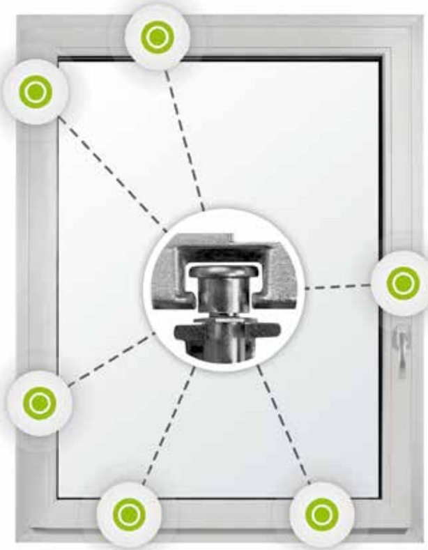
6-fach Sicherheit im Standard

Wir bei STOLMA wissen, dass nur erstklassige Beratung und Ausführung - vom Aufmaß bis zur Montage - die perfekte Optik und langlebige Qualität unserer hochwertigen Produkte garantieren.