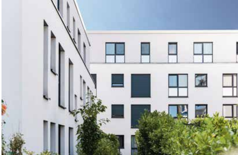
Unser Referenzprojekt mit Aluplast Fenster + Türen: Washingtonplatz in Darmstadt